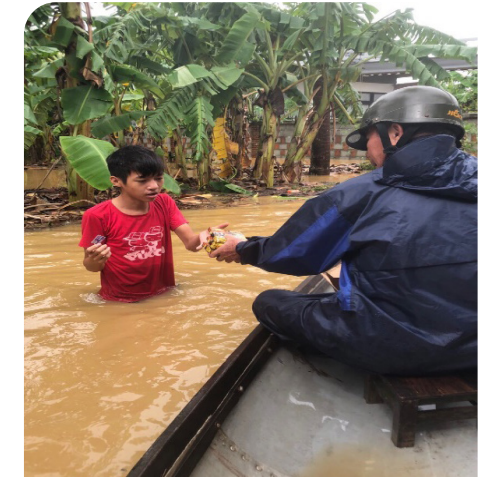
Ảnh 3: NCT chuyển mì tôm cho gia đình bị cô lập bởi nước lũ.