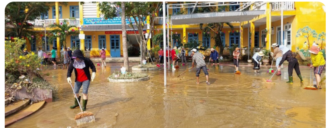
Ảnh 4: NCT giúp vệ sinh sân trường sau cơn bão Noru.