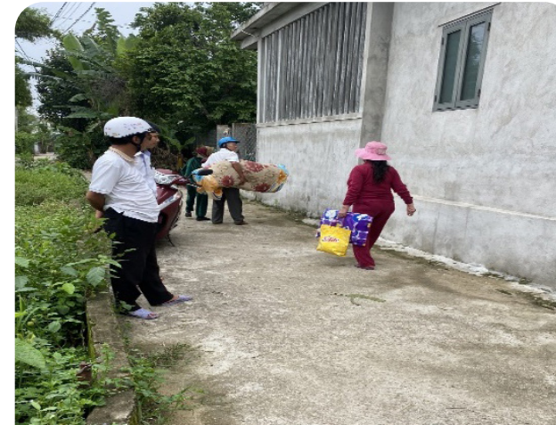
Ảnh 2: Hội NCT phường vận động NCT di dời đến nơi an toàn.

Hội NCT là một trong các Hội có số hội viên lớn nhất cả nước. Phát huy vai trò của Hội NCT sẽ huy động được lực lượng đông đảo, dày dặn kinh nghiệm và uy tín để tham gia công tác PCTT.